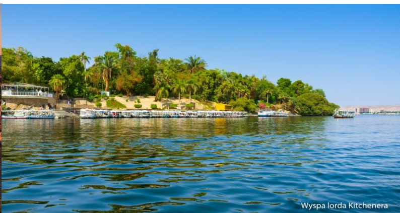
Wyspa lorda Kitchenera

Szczegóły i zapisy w biurze KOTLA TRAVEL ul. Smolańska 3, ap.117, 70-026 Szczecin tel. 608 122 492 e-mail: biuro@kotlatravel.pl